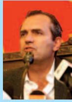
Luigi de Magistris

NAPOLI. Il sindaco firma a Ferragosto un'ordinanza urgente per scongiurare l'emergenza. Sbloccata la vertenza dei Cub: la Sapna pagherà 900mila euro. ■ a pagina 10