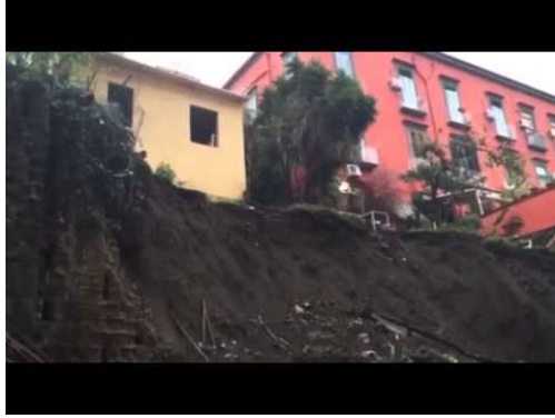
Chiaia, frana in via Palasciano