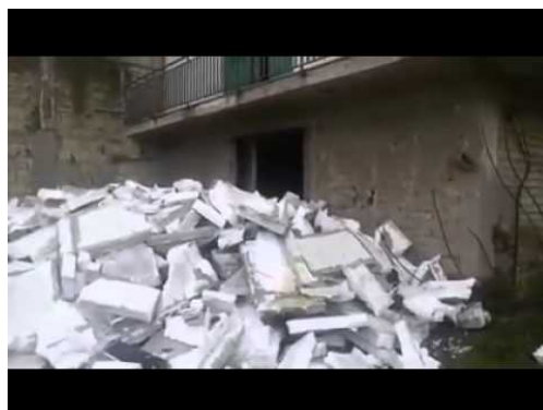
San Marcellino, il rogo di rifiuti in diretta