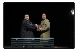
Freud e Marx, dialogo surreale al tempo della mort...