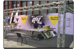
VideoGameShow, per 3 giorni Napoli capitale di sma...