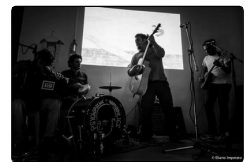
Il folk-rock acustico dei Psychopat...