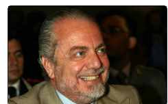
Sorrento, De Laurentiis se la prende col cinema it...