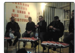
Curre curre Napoli, 25 anni di lotte cittadine nel...