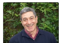
Teatro Sannazaro, il ricordo e il tributo