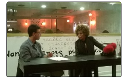
Passioni mediterranee sull'asse Napoli-Tunisia nel...