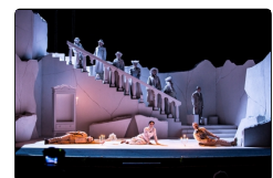
"Il giardino dei ciliegi" al Mercadante,...