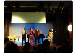
Radio Libertà, lo spirito di Napoli nella B...