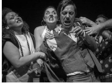
Una scena di "Hamlet Travestie"

«Dal 13 al 18 prossimi con una serie di spettacoli ed incontri aperti al pubblico - ha continuato Russo - cercheremo di produrre una fotografia dell'esistente, sia dal punto di vista artistico che da quello organizzativo, con un occhio particolare ai circuiti "off", sempre più penalizzati per la mancanza di finanziamenti. Questo comporta che alcune produzioni di giovani compagnie, anche di ottima qualità, finiscono con il morire. Con "Turn Over" intendiamo promuovere "più spazio per crescere" per quelle eccellenze spesso mortificate e rese invisibili da un sistema privo di stimoli e ingessato in un pre-