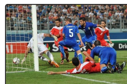
A Malta nessuno è meglio di Pellè, m...