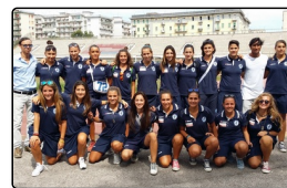
Napoli Calcio Femminile, un centro per formare i n...