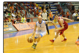
Givova Napoli, primo successo stagionale: Forligr...