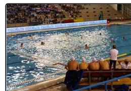
Pallanuoto, il derby alla Canottieri: Posillipo ko...