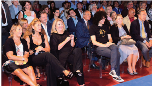
Alcuni protagonisti del premio andati in scena all'Agorà Morelli