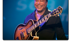
George Benson al Pomigliano Jazz Festival: suoner&...