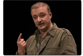
Il terrone 2.0 e l'Unità d'Italia, applausi...

Risparmio energia di Safari Fai clic per avviare il plugin Flash