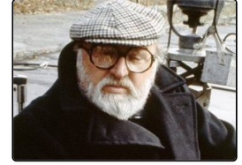
Sergio Leone, 25 anni fa moriva il rivoluzionario ...