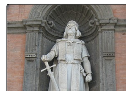
Passeggiando per Napoli - Ruggero d'Altavilla e l'...