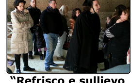
"Refrisco e sollievo a chest'ane...