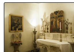
Napoli, riapre la cella di San Tommaso d'Aquino pe...