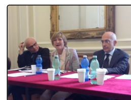
Eduardo De Filippo, l'omaggio del San Carlo nel tr...