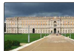
Reggia di Caserta, il ministero stanziava 5 milioni ...