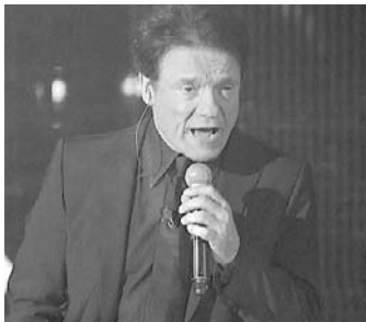
● Massimo Ranieri

L'intenzione è quella di fare uno show televisivo diverso dai tradizionali contenitori: Massimo Ranieri canta, oltre alle sue canzoni, brani di grandi cantautori tra cui anche le più belle canzoni napoletane.