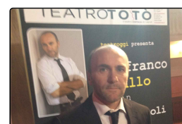
"Quartieri Spagnoli", Gianfranco Gallo r...