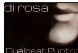
I Dualbeat Puntoit ridanno voce a "Bocca di r...