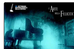
La recensione: L'Arte della felicità ...