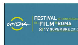
La recensione: speciale Festival Internazionale de...