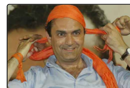
"Il pubblico mistero", presentata la bio...