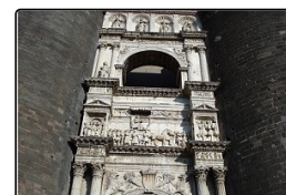
I sette castelli di Napoli - La retata dei baroni ...