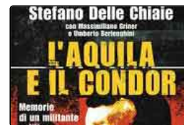
Le memorie politiche di Stefano Delle Chiaie ed il...