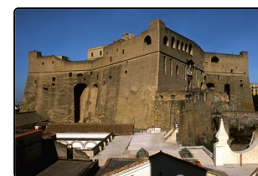
I sette castelli di Napoli - Quel seme della liber...