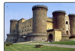
I sette castelli di