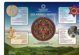
Elisir mercuriali e immortalità, convegno s...