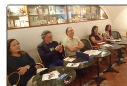
La nuova stagione del Tan e la "Rete dei Picc...