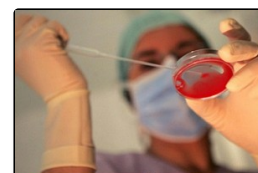
Fecondazione assistita, la legge 40 tra incoerenze...