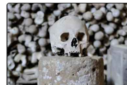
"Refrisco e sollievo a chest'anem&rsquo...