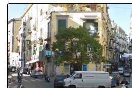
Una passeggiata alla riscoperta dell'antico borgo ...