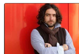
Minacce a Giulio Cavalli, annullato lo show al Nuo...