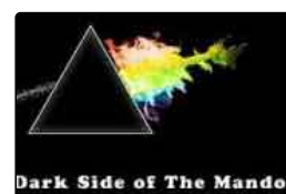
"The dark side of