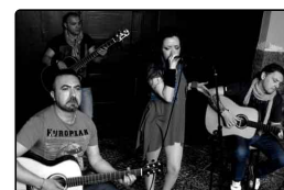
La musica d'autore italiana rivive nelle canzoni d...