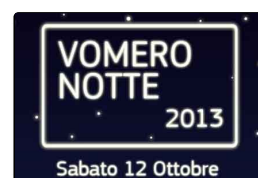
Vomero Notte, il piano-trasporti: Metro e Funicola...