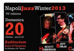
Napoli Jazz Winter, sarà una settimana edizio...